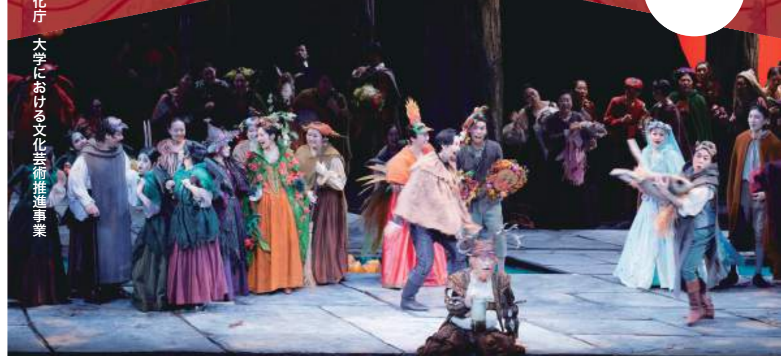
平成23年度大学オペラ「ファルスタッフ」上演風景