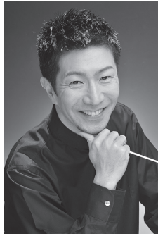
指揮／時任 康文 Yasufumi Tokito, Conductor

武蔵野音楽大学器楽科卒業後、東京音楽大学指揮科に学ぶ。指揮を紙谷一衛、汐澤安彦両氏に師事。在学中より二期会、日生劇場を中心に音楽スタッフとして小澤征爾氏、秋山和慶氏、若杉弘氏、佐藤功太郎氏等のアシスタントを務めた。1990年「東京の夏」音楽祭に於いて、カールマン作曲オペレッタ《チャールダッシュの女王》を指揮してデビュー。その後、数々のオペラ団体と共に、オペラの主な作品を指揮する。またオーケストラへの客演も多く、東京交響楽団、東京フィル、日本フィル、新日本フィル、東京シティ・フィルハーモニック、名古屋フィル、神奈川フィル等を指揮し好評を博す。1996年度文化庁派遣芸術家在外研修員として渡伊。ネッロ・サンティ氏のアシスタントとして、チューリッヒ歌劇場、メトロポリタン歌劇場等に同行し研鑽を積んだ。2001年には、ウズベキスタン・カザフスタンに於いて、故園伊玖磨氏の意志を引き継ぎオペラ《夕鶴》を指揮。新国立劇場小劇場シリーズでカール・オルフ作曲《賢い女》を指揮し好評を博す。東京オペラプロデュース公演にてV. ウィリアムス作曲オペラ《恋するサー・ジョン》の本邦初演を指揮。その後の本邦初演作品オペラはマルシュナー作曲《ヴァンパイア》、シャルパンティエ作曲《ルイズ》、ジョルダノ作曲《マダム・サンジェヌ》、アルファード作曲《シラノ・ドゥ・ベルジュラック》、ジョルダノ作曲《戯れ言の饗宴》、レスピーギ作曲《ベルファゴール》等を指揮し、オペラ指揮者としての存在感を大いに印象付けた。2022年4月、藤原歌劇団本公演に於いてヴォルフ・フェラーリのオペラ《イル・カンピエロ》を2023年4月ガエターノ・ドニゼッティのオペラ「劇場のわがままな歌手たち」を指揮した。吹奏楽とも関わりが深く、東京の乗泉寺吹奏楽団の常任指揮者を8年間務め全日本吹奏楽コンクールに5年連続出場、3年連続金賞受賞した。近年では、東京佼成ウインド・オーケストラ、東京吹奏楽団、大阪市音楽団、シエナ・ウインド・オーケストラ等、プロフェッショナルな団体に度々客演指揮している。2001年度には吹奏楽コンクール課題曲参考演奏を東京佼成ウインド・オーケストラと共に録音。又、スタジオミュージシャンを中心に集めた大江戸ウインド・オーケストラでは吹奏楽の新しい可能性を追求している。昭和音楽大学の公演に於いて、2020年昭和音楽大学管弦楽団第39回および2021年第40回定期演奏会、2021年第46回および2022年第47回メサイア公演を指揮した。また、2020年第11回および2021年第12回音楽大学オーケストラ・フェスティバルおよび2023年8月フェスタサマーミュージザKAWASAKI2023 昭和音楽大学管弦楽団xテアトロ・ジューリオ・シウワ・オーケストラを指揮した。昭和音楽大学教授。