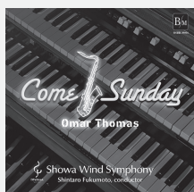
(OSBR-39001) 価格 ¥2,750 (税込)