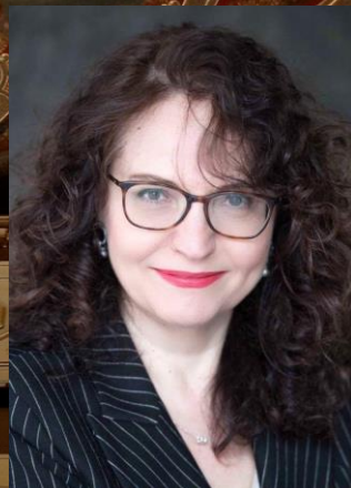
ベルカント・オペラ・フェスティバル芸術監督 カルメン・サントーロ氏