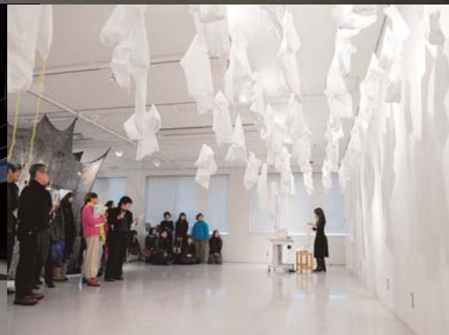
左：2012年の基礎篇 中：KAAT 神奈川芸術劇場大スタジオ 右：女子美術大学学生の作品（公演で使用するものとは異なります）

日時 2013年10月20日（日） 14:45 開場 15:00 開演 会場 KAAT 神奈川芸術劇場 大スタジオ