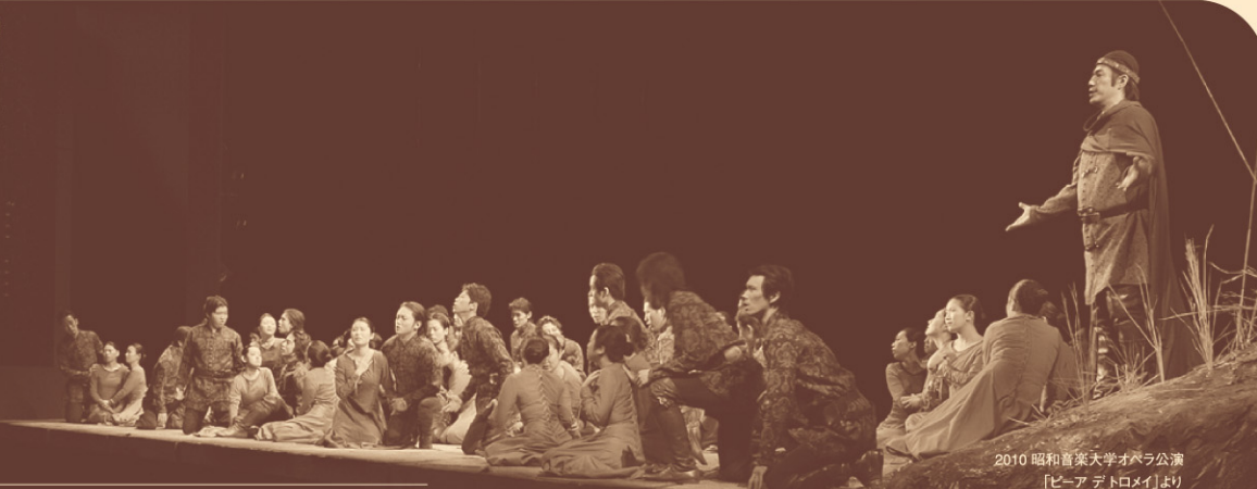
2010 昭和音楽大学オペラ公演 「ピア デトロメイ」より